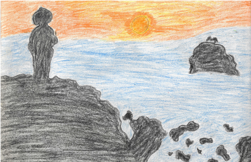
Imagem 7 – Solidão de Nito na prisão

Fonte: Eronilton F. dos Santos, Casa de Prisão Provisória, Aparecida de Goiânia, 06/12/98.