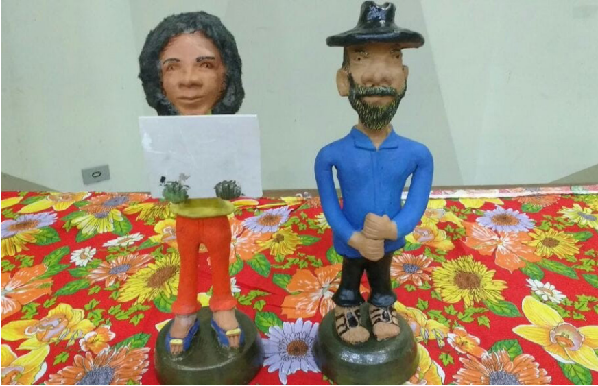
Imagem 4 – Esculturas de Argila de Deusdet e Matraga

Fonte: a foto e as esculturas pertencem ao acervo de H. Massanaro.