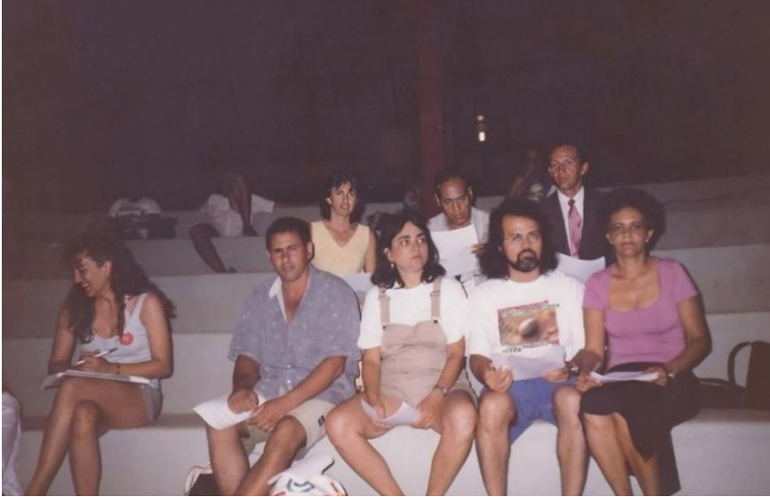
Imagem 2 – Delegação de Goiás no Encontro de Paripueira (AL), em 1999