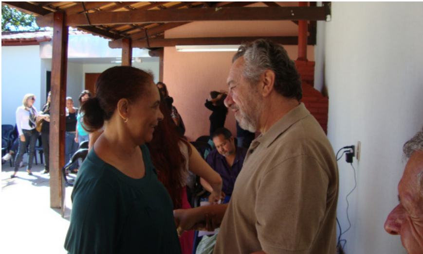
Imagem 8 – Inauguração do Centro de Convivência Cuca Fresca