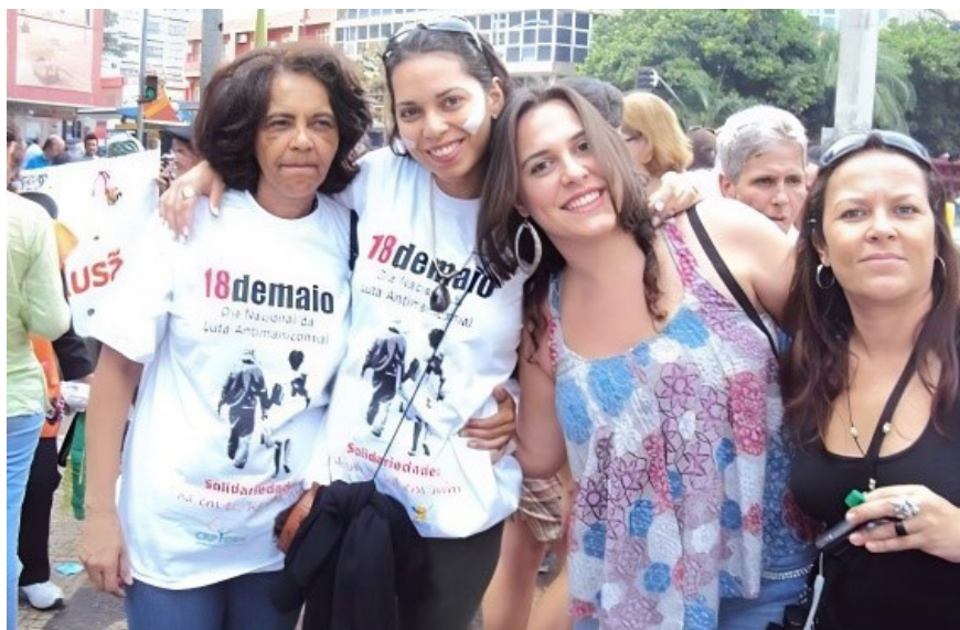
Imagem 14 – Manifestação pública no 18 de maio

A III Conferência Nacional de Saúde Mental realizada em dezembro de 2001 manifestou-se contra a reclusão do louco infrator em Manicômio Judiciário e apontou a necessidade de se discutir essa questão com as diferentes áreas envolvidas, com o objetivo de garantir a responsabilidade do estado pela reinserção social e assistência, de acordo com os princípios do Sistema Único de Saúde (SUS) e da Reforma Psiquiátrica.