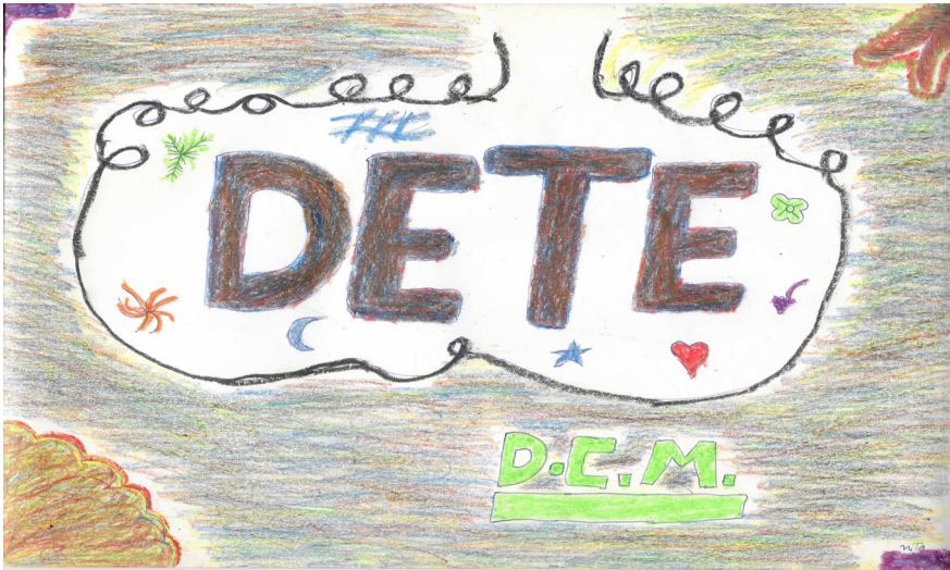
Imagem 1 – Homenagem de Nito