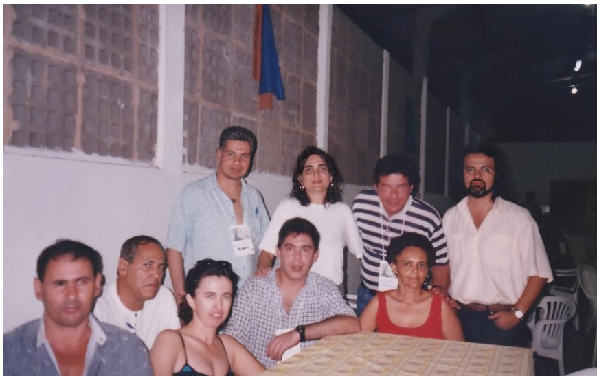
Imagem 9 – Encontro de Paripueira (AL), de 22 a 26 de setembro de 1999