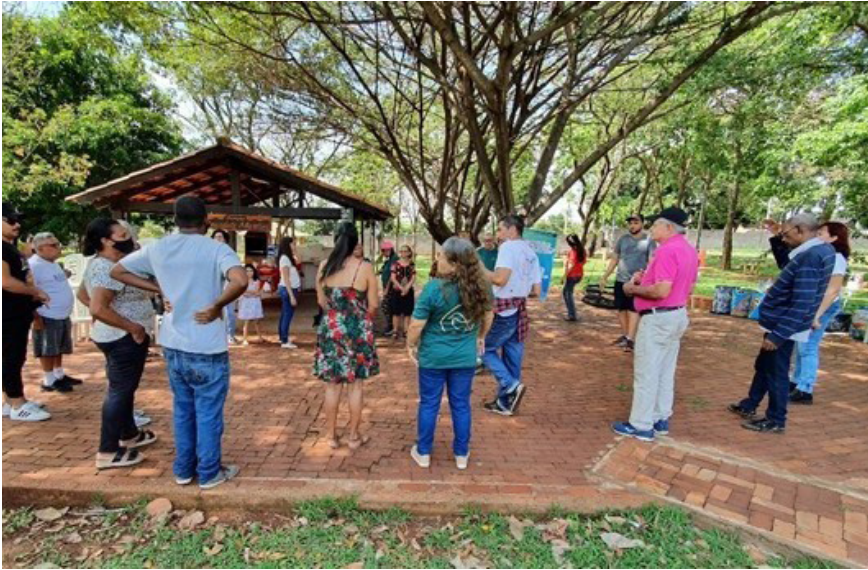
Imagem 16 – Ato do 18 de maio de 2022 no Quiosque ‘Deusdet’ no SINDSAÚDE

Oriundos de parcerias com o Ministério da Saúde, Ministério da Justiça, Secretaria Estadual de Saúde, Tribunal de Justiça de Goiás, Ministério Público, Secretaria de Segurança Pública, Universidades e incentivos de acordo com a Portaria Interministerial nº 1777, de 09/09/03.