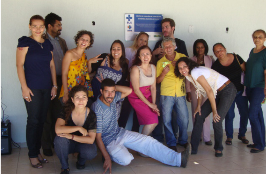
Imagem 13 – Inauguração do Centro de Convivência Cuca Fresca